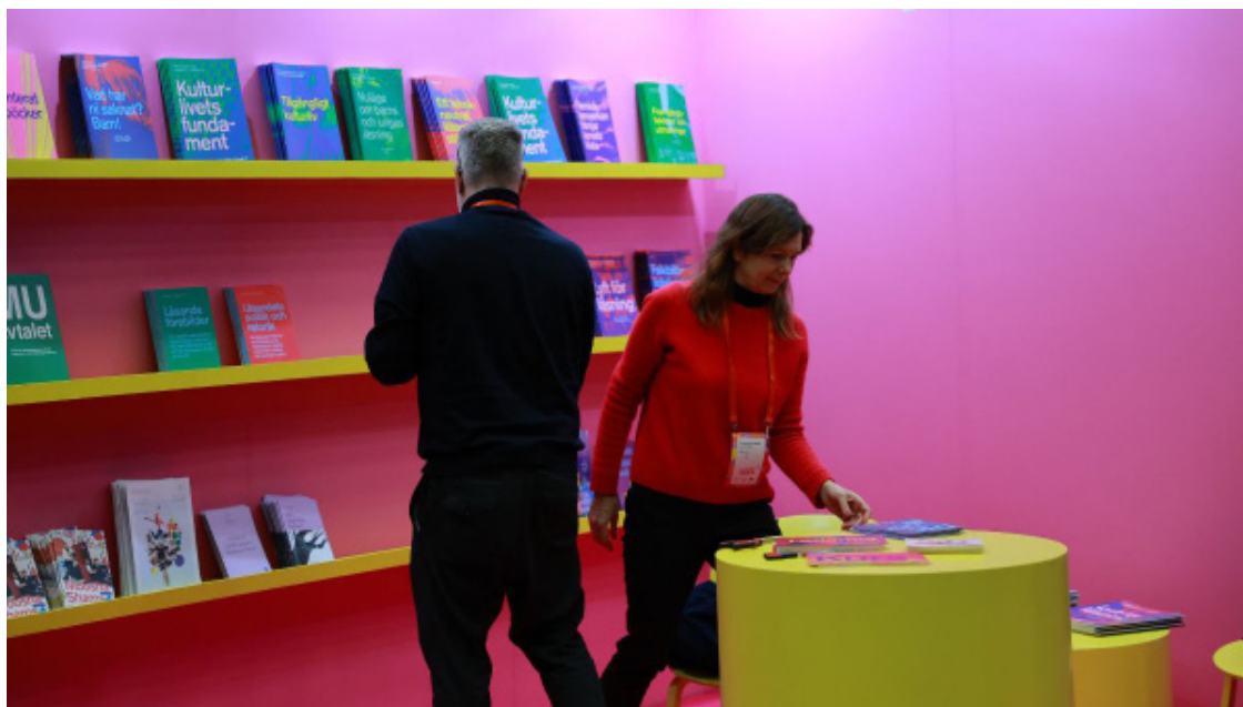
Kulturrådets monter under Folk och Kultur 2024.

Utställartorget är mötesplatsen där besökarna kan knyta nya kontakter, få inspiration och ny kunskap. Här finns Stora scenen för publikdragande seminarier och scenkonst, café och restaurang/matställen, prova på-aktiviteter, laddstation för mobilen och "bara vara"-sittplatser. Besökare kan komma in på Volvo CE Arena utan deltagarpass.